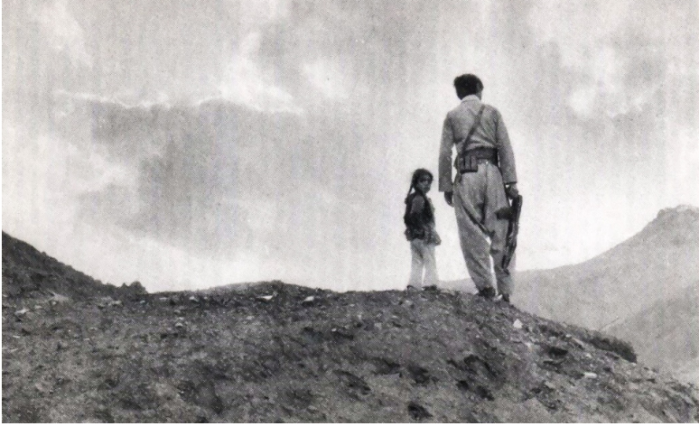
پنشمه رگه یه ک و کچه که ی؛ کۆبوونه وه ی مالبات