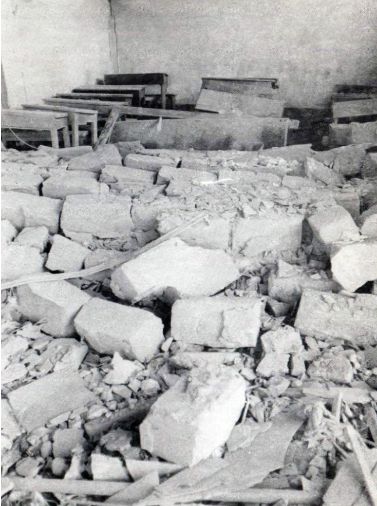
پاشماوهى قوتابخانه و په حلهى قوتابيان