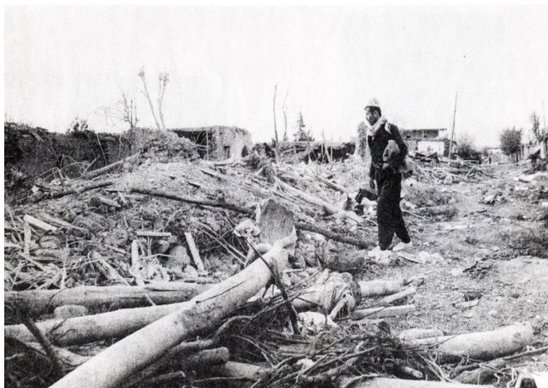
خاپوورکردنی گهړه کیک له قه لادزی