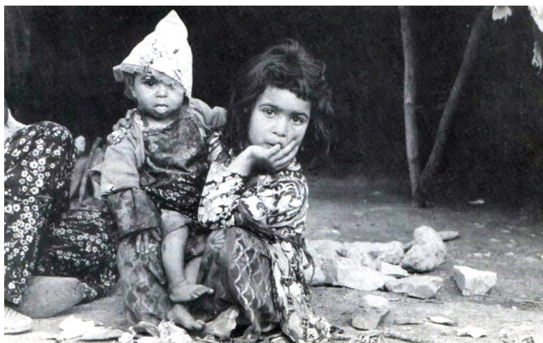
ئهوهی له مأل و مالباتیکهوه به جیماوه دواى هێرشیکى ئاسمانى