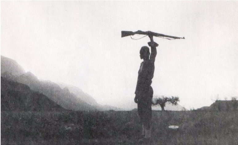
هیزی پنشمه رگه له به ره ی جهنگ چه که که ی پنشانده دا بو به ره چدانه وه ی هیرشی عیراق