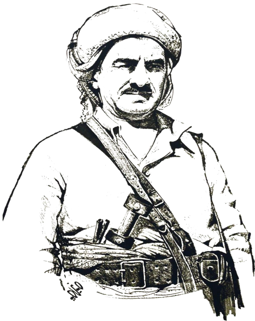
باوکی روحی و نه ته وه پی سه رۆک مسته فا بارزانی